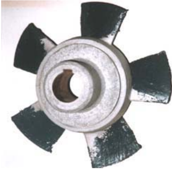
PHASE 3 Egalisation du travail de reconstruction avec CERAMI-TECH EG