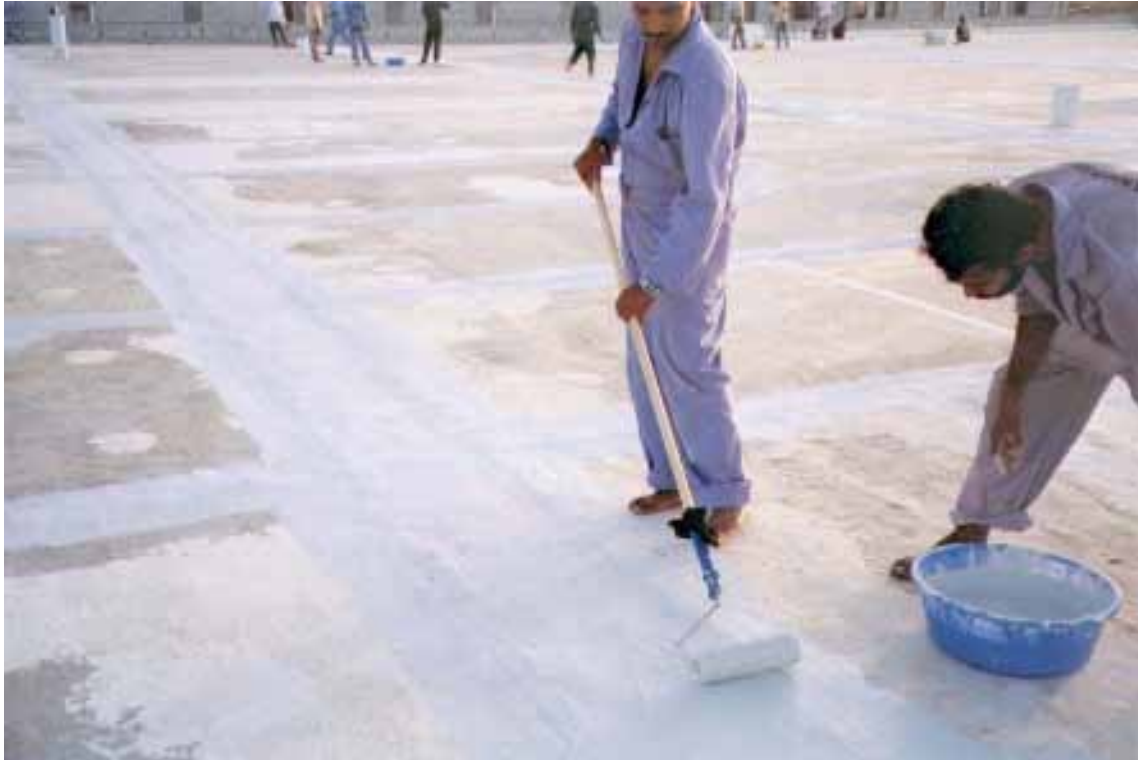
Enduit des surfaces de jointures avec « Poly-Tech BP Primer »