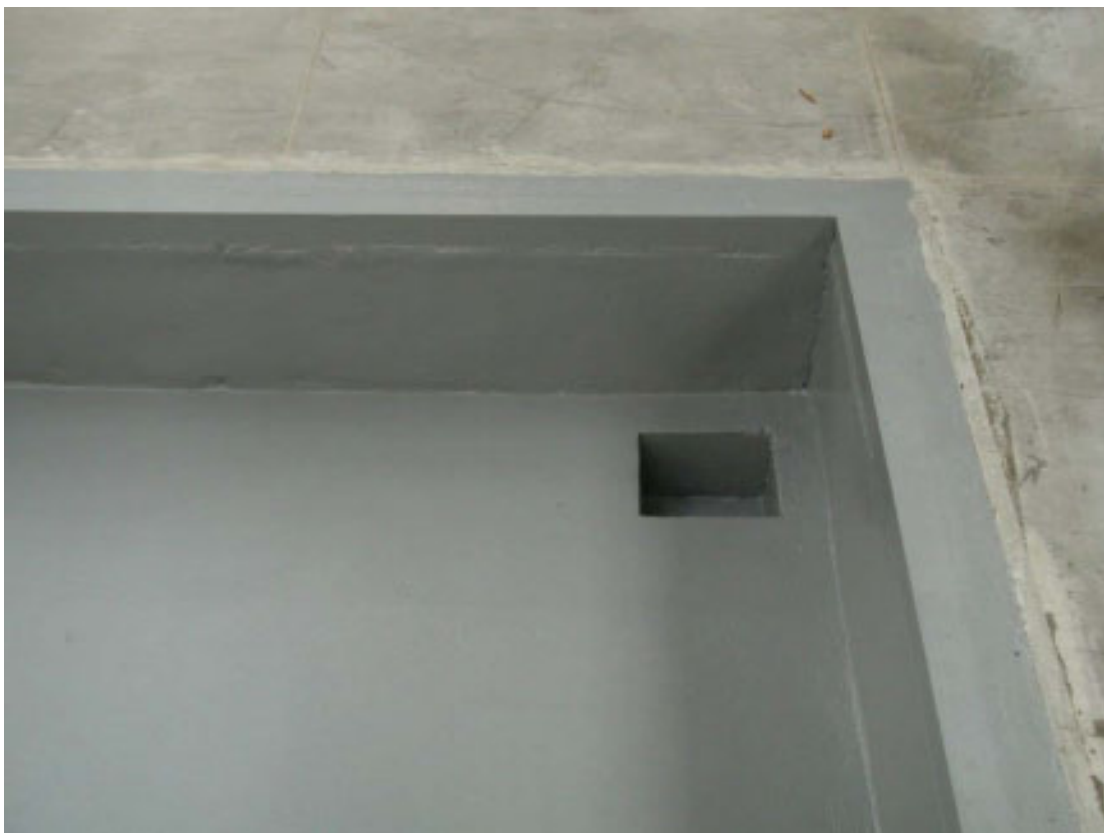
UNE VUE DE LA PERCEE DANS LA CHAPE RELIEE A LA POMPE D'ASPIRATION DES HUILES USAGEES