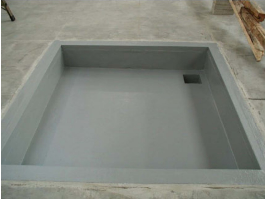
ICI LA VUE D'UN BAC DE COLLECTE