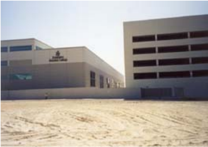
1/Passage du grinder Vue de la terrasse avant le passage du grinder