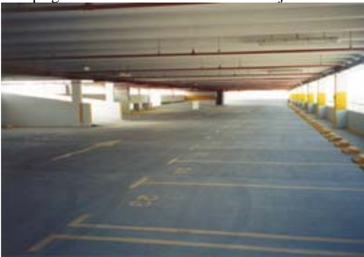
Vue après marquage au sol avec FLOOR-TECH UV jaune