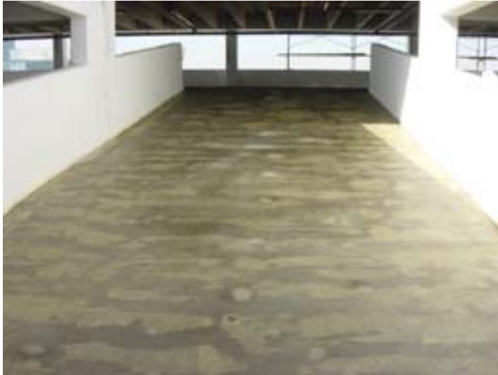
13/Application du GRANO-TECH sur les rampes