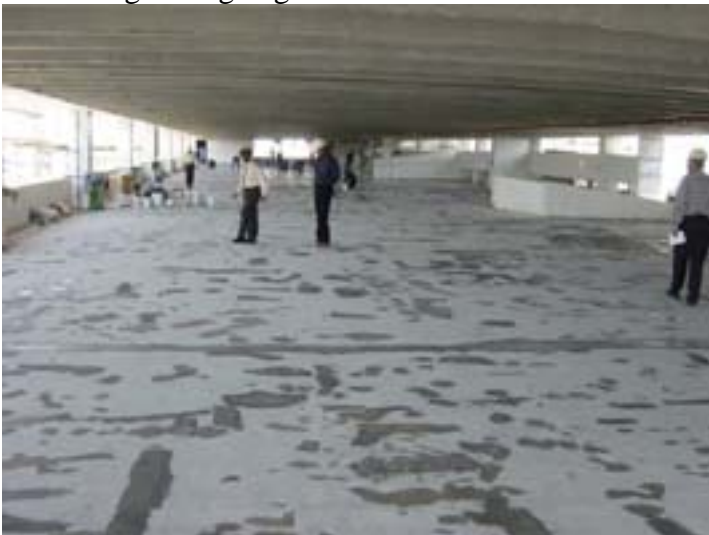
6/Vue du chantier en cours de ragréage