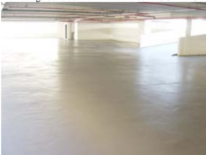
12/Vue du chantier après application de la couche de finition UNITECH-TECH UV