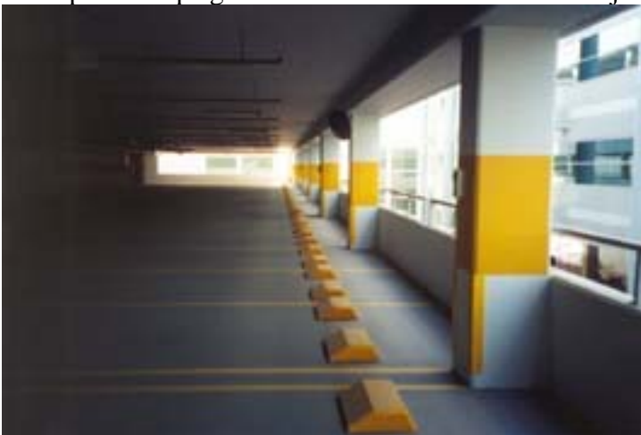
Marquage aux murs avec FLOOR-TECH UV Vue d'une partie de parking terminée