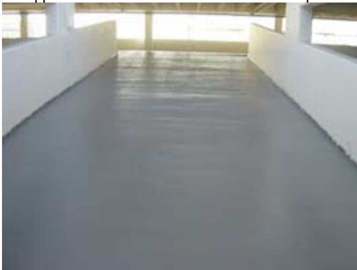
14/Vue de la rampe après passage du FLOOR-TECH SFU PRIMER + FLOOR-TECH FBX + la couche de finition FLOOR-TECH UV + THORTEX HD GRIP incolore