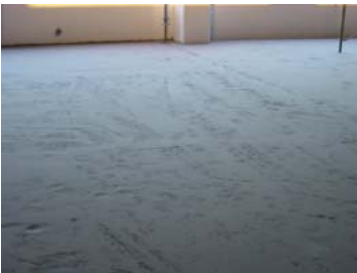
3/Nettoyage et évacuation de tous débris, dépoussiérage