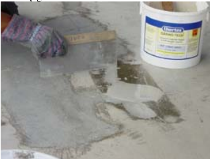
5/Bouchage et ragréage avec GRANO-TECH