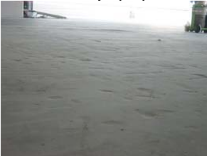
2/Vue après passage du grinder