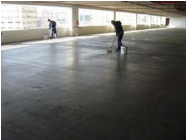
11/ Passage de la deuxième couche de FLOOR-TECH FBX