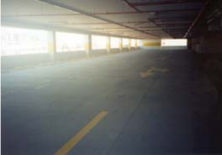
Marquage au sol avec FLOOR-TECH UV jaune