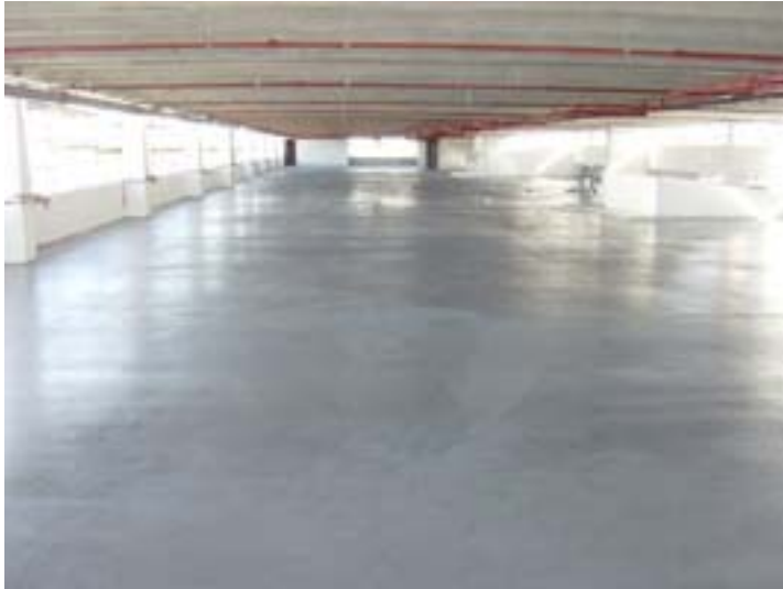
10/Vue du chantier après passage à la brosse d'une couche de primaire FLOOR-TECH SFU PRIMER et d'une couche de FLOOR-TECH FBX