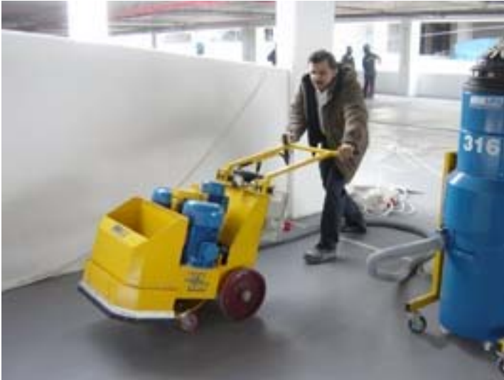
4/Surfaçage au blast-track soft